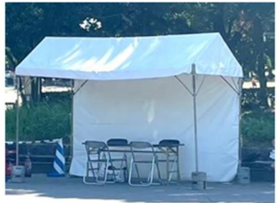
大ブースのイメージ